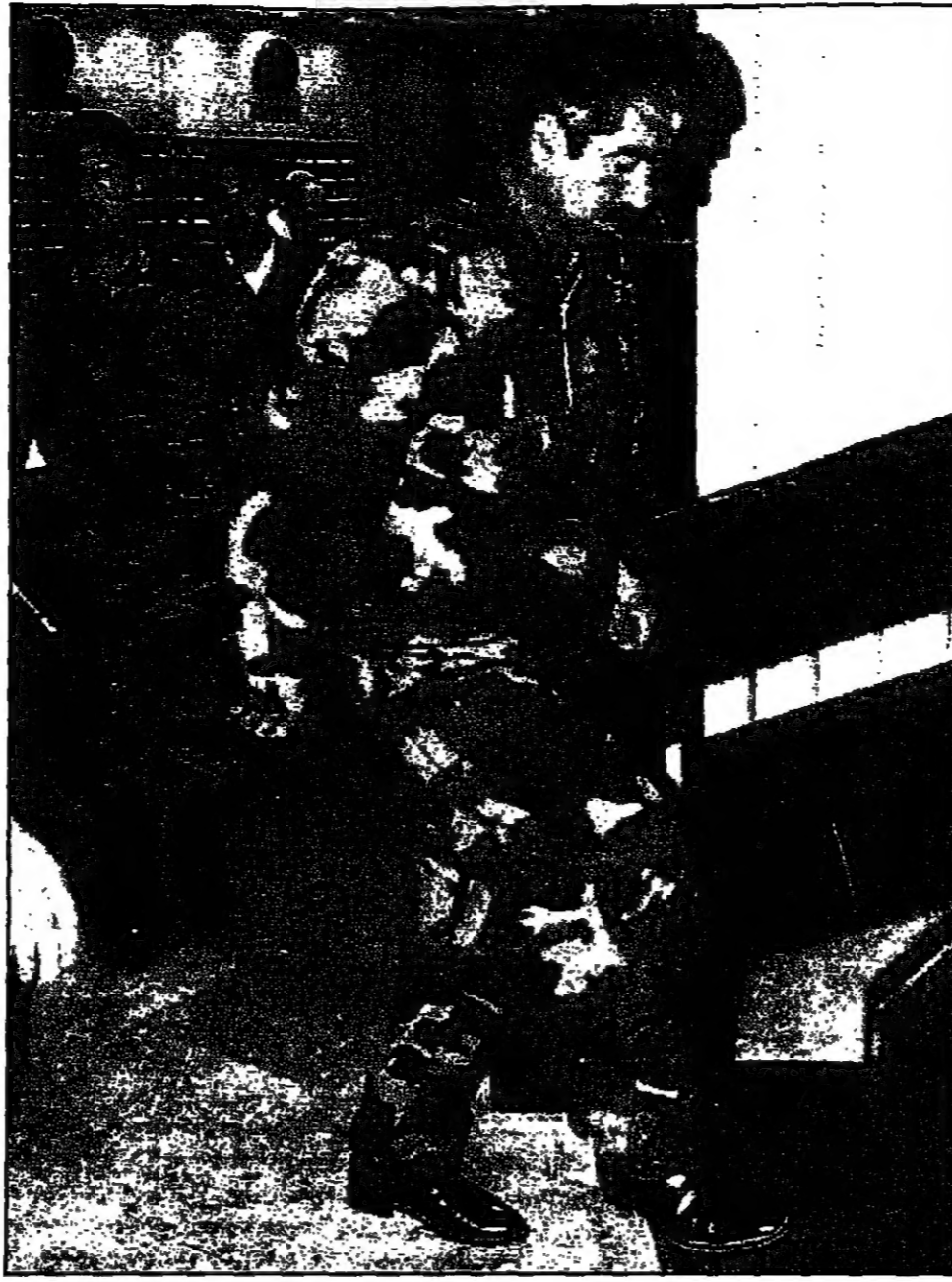
الجنرال عبد الرشيد دستم زعيم لحزب الأوزبكي الانفصالي لدى وصوله إلى أحد فئات العاصمة التركية

كابول - من تيم جونسون؛ استقبلت موسكو - موسكو - واشنطن - وكالات قال مستخدم باسم وزارة الخارجية التركية ان الجنرال الافغانى المعارض عبد الرشيد دستم الذي خرجته ميليشيا حركة طالبان الاسلامية من معقله في شمال البلاد وصل الأحد الى العاصمة التركية أنقرة. وقال المتحدث باسم وزارة الخارجية التركية طاجنرال الافغانى وصل الى أنقرة صباح الأحد ولم يقدم مزيداً من التفاصيل. وقال مراسل رويترز في أفغانستان ان مدينة مزار الشرف مستلمة من قبل طالبان حركة طالبان الاسلامية. وقال مراسل آخر في كابول ان حركة طالبان الاسلامية قد سيطرت على مناطق واسعة في شمال البلاد. وقال مراسل رويترز في كابول ان حركة طالبان الاسلامية قد سيطرت على مناطق واسعة في شمال البلاد. وقال مراسل آخر في كابول ان حركة طالبان الاسلامية قد سيطرت على مناطق واسعة في شمال البلاد.